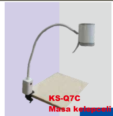
KS-Q7C Masa kelepçeli